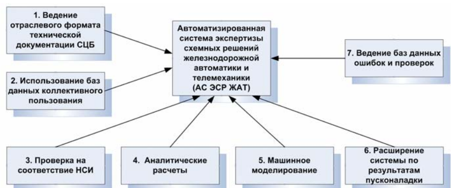
Рис. 1. Концепция построения автоматизированной системы экспертизы схемных решений железнодорожной автоматики и телемеханики (АС ЭСР ЖАТ)