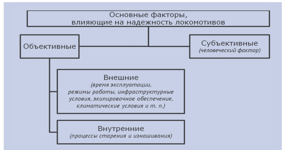
Рис. 3. Основные факторы, влияющие на надежность локомотивов в эксплуатации

Таким образом, в результате в положениях ТЗ установлена номенклатура нормируемых показателей надежности, изменяющаяся в течение ЖЦ (табл. 2), определены точки контроля этих показателей.